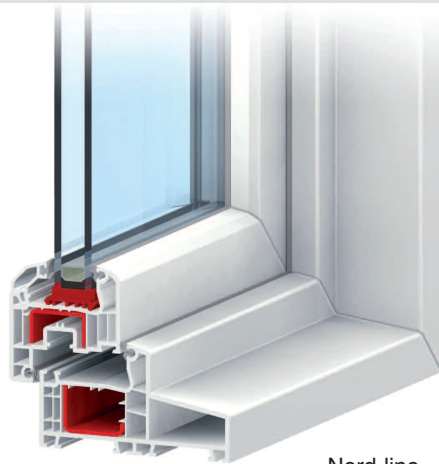
Nord-line IDEAL 4000®